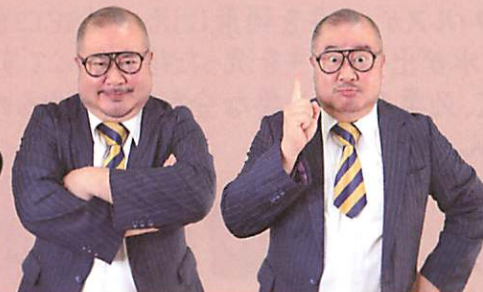
友情出演：芋洗坂係長