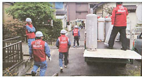
ガスボンベを回収する配送センター