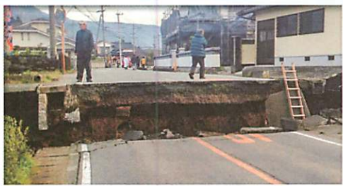
一人分ほどの段差が…。

早いもので2016年4月14日の前震、4月16日の本震から5年がたちます。地震大国の日本…。全世界で起きている地震の15%が、さらにマグニチュード6.0以上の大地震に至っては約20%が日本で発生しているそうです。今年2月の東北での震度6強の地震では5年前の熊本地震での恐怖が鮮明に蘇った方も多いのではないのでしょうか?!